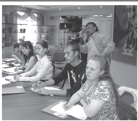
Öкмысöд Гожся университет. Велөдчан здукъяс. Ставöн сюся кывзöны, ставсö сюркнялöны пель сайö...